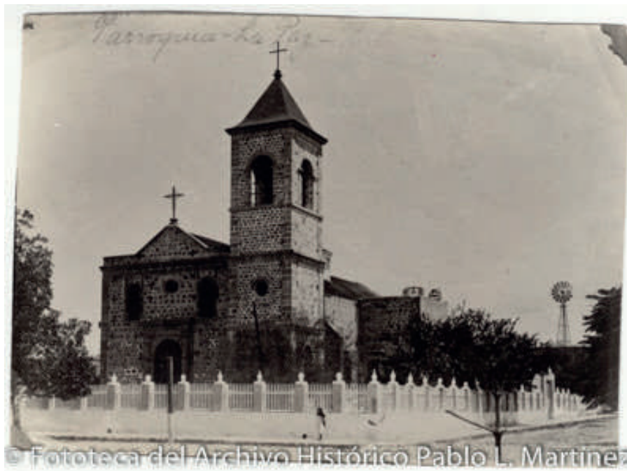
Parroquia de Nuestra Señora del Pilar de La Paz con una torre.